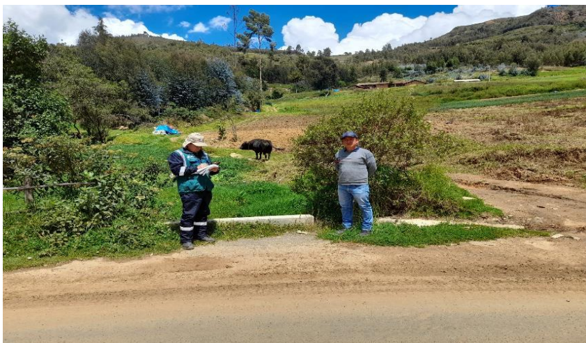
IMAGEN N°01: Se observa la quebrada Jardin Coipin requiere de mantenimiento de cauce