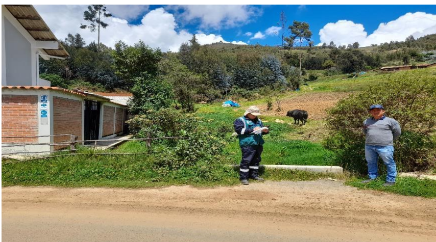
IMAGEN N°02: la quebrada Jardin requiere de conformacion de bordos y encausamiento para proteccion de viviendas y trocha carrozable